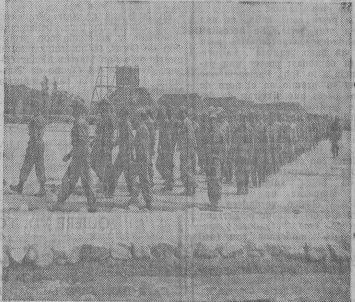
Soldados filipinos en formación en un campo de entrenamiento en Corea