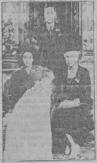
JORGE VI, CON SU MADRE, HIJA Y NIETO

Como siempre, al país se le informa con lealtad en todas sus dificultades y problemas, y acerca de la grave enfermedad actual de su Rey el pueblo es ahora informado detalladamente y hasta con crudeza. La continuidad de la tradición inglesa es inexorable y la raigambre monárquica británica es profunda e inmovible.