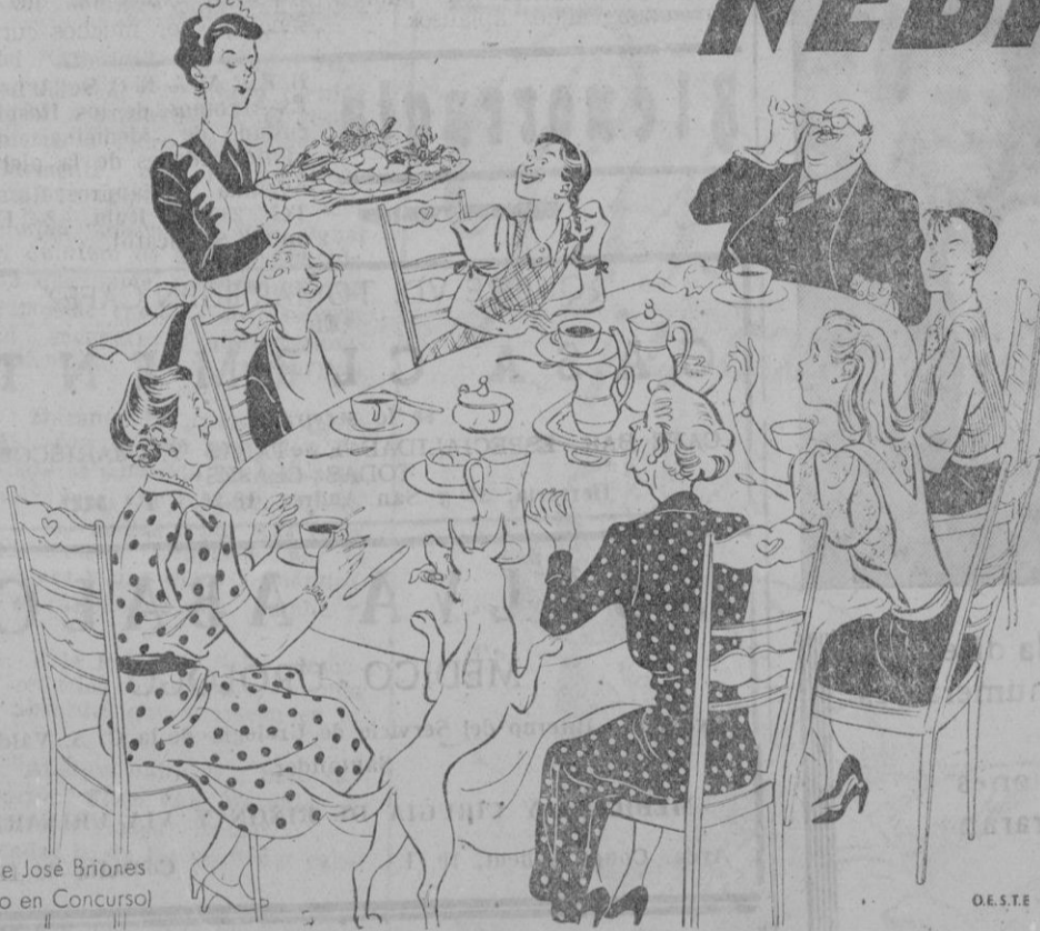
Dib. de José Briones Premio en Concurso