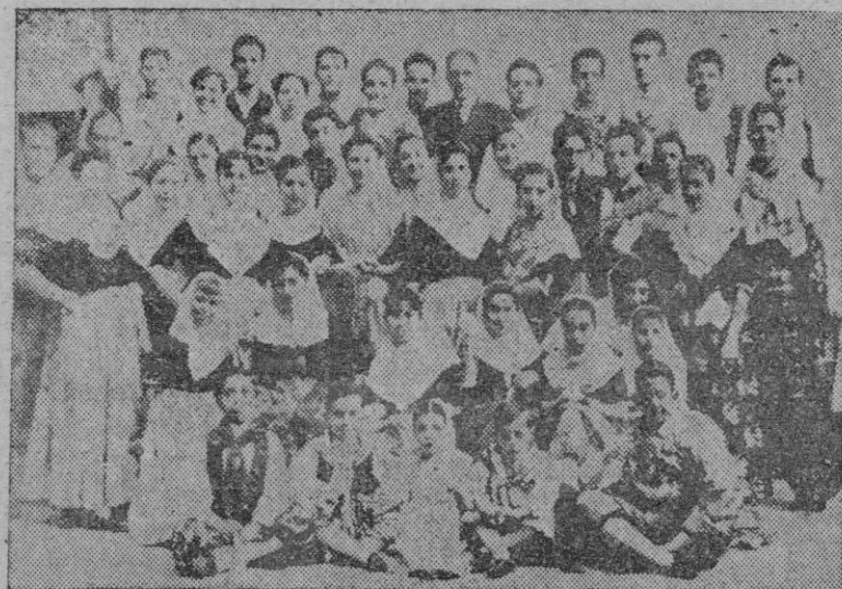
La magnífica agrupación "Balls Mallorquins" de Palma, que tan lucida actuación tuvo en el Concurso celebrado en el Balear, donde le fué adjudicada al igual que al Grupo de Galicia, la mayor puntuación. Participará por lo tanto en el II Certamen Internacional.