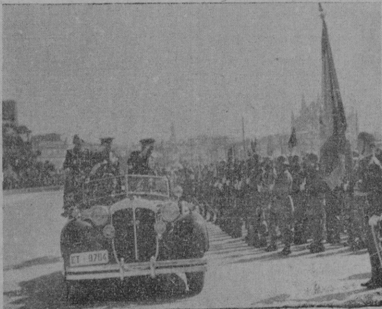
El Excmo. Sr. Capitán General revista a las fuerzas que tomaron parte en el brillante desfile del domingo