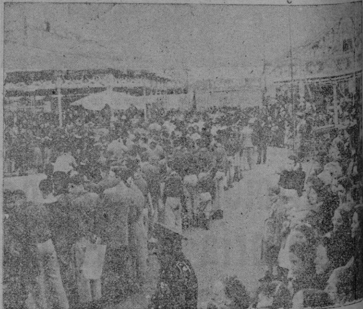
Aspecto de la Feria durante la ceremonia inaugural