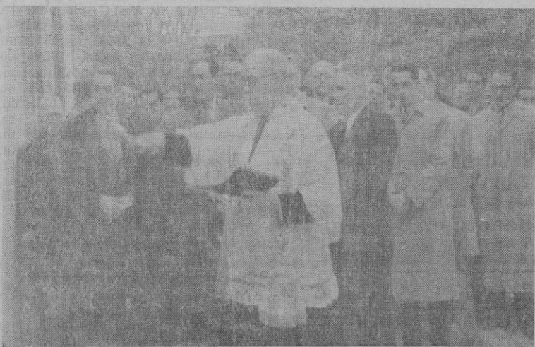
Bendición de la fuente-abrevadero en Sancellas, acto celebrado el lunes por la tarde

Finalmente el Sr. Ibáñez Martín dijo que ha pasado a la Sección de Investigaciones del Instituto de Investigaciones y Exposiciones Cinematográficas a depender del Consejo y que actualmente se halla en estudio el título facultativo a dar por este Instituto. — Cifra.