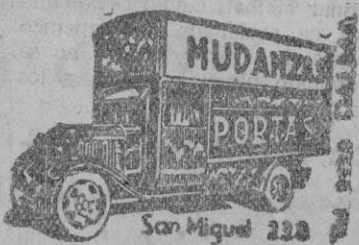
San Miguel 228