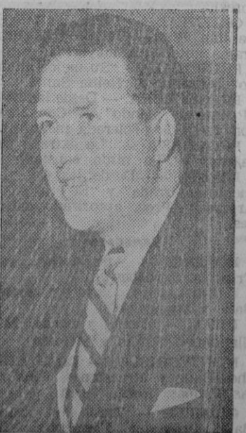
HENRY FORD II

Inglaterra, a su vez, anuncia que a primeros de abril de este año las fuerzas armadas británicas comprenderán 800.000 hombres, que la producción de tanques, aviones —los nuevos bimotores "Camberra", tetramotores a reacción, últimos tipos de caza, etc.— y barcos, se habrá duplicado, que para este verano llamará a filas unos 250.000 hombres como ensayo de movilización y de maniobras militares en gran escala, y que el plan de rearme costará 517 mil millones de pesetas (4.700 millones de libras).