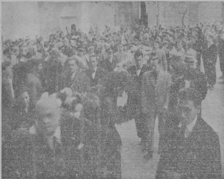
La comitiva dirigiéndose a la Catedral, para depositar la ofrenda floral en homenaje a José Antonio Primo de Rivera

En los bancos centrales situáronse, en primer término, todas las representaciones de Falange Española Tradicionalista y de las