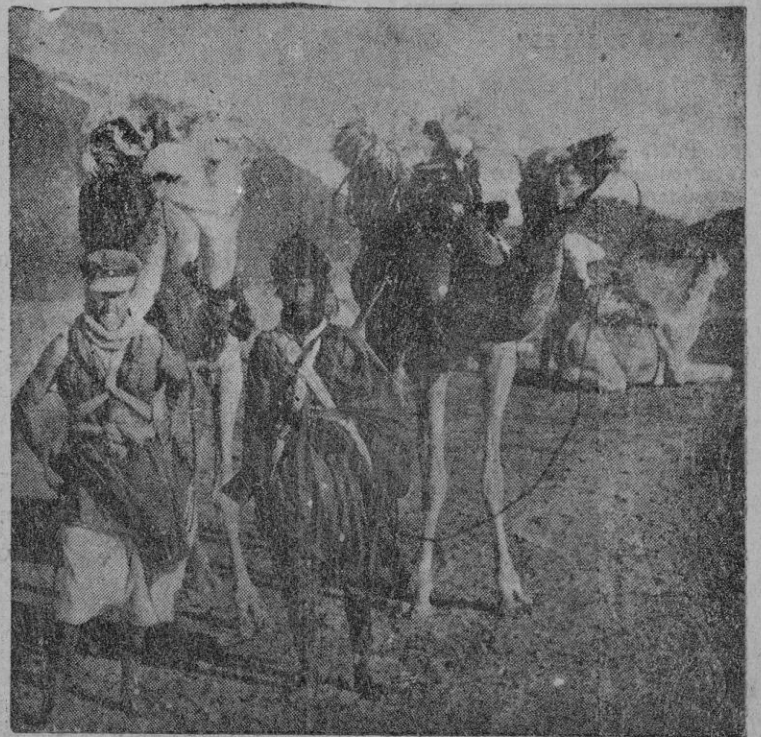
Las informaciones del viaje de S. E. se han referido al grupo nómada "Capitán de la Gándara". La fotografía muestra a un oficial de ese grupo junto a un indígena en pleno desierto