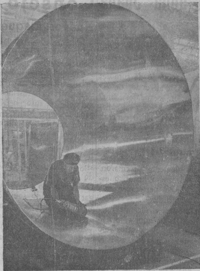
Las modernas investigaciones sobre la corrosión de los metales ha permitido construir una instalación de pasteurización rápida, que evita gran parte del trabajo de limpieza y conservación, y está basada en la reacción de la leche y jugos de frutas con ciertos metales. En el grabado, un obrero pule las soldaduras de un depósito para el pasteurizador.