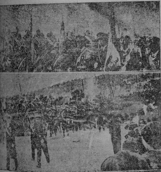
La foto superior la tribuna con las autoridades. - Abajo, un momento del desfile.

Madrid.- Esta mañana se ha celebrado en el Paseo de la Castellana el desfile militar conmemorativo de la Victoria ante S. E. el Jefe del Estado. Madrid ha tenido ocasión, una vez más, de expresar su fervor patriótico y su inquebrantable adhesión a la figura de nuestro invicto Caudillo, con inequívocas demostraciones de entusiasmo.