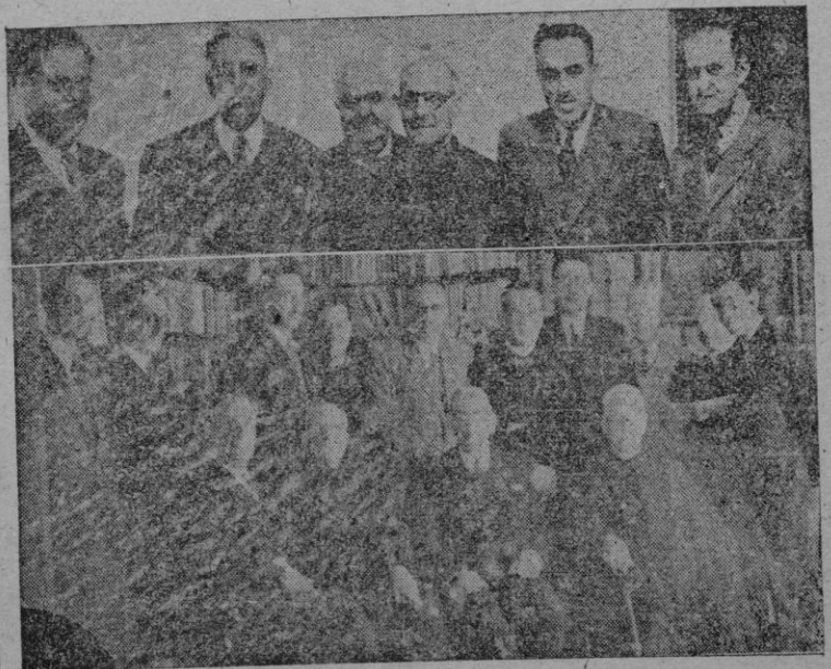
Foto superior: El doctor Pears rodeado de los amigos que fueron a saludarle poco después de su llegada a Palma. - Abajo: Los miembros de la Escuela Lulista durante la recepción ofrecida ayer al ilustre huésped. - Lateral: Una fotografía del doctor Pears obtenida pocos momentos después de su arribada a nuestra ciudad a donde llegó el viernes con objeto de pasar unos días de asueto antes de reanudar sus actividades profesionales.