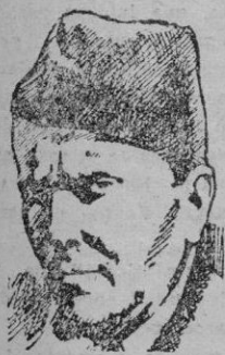
Tito, objeto de los "elogios"...