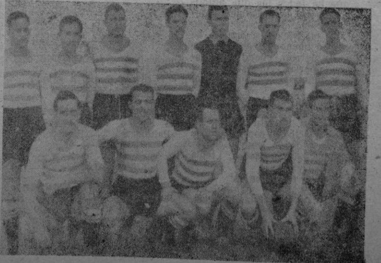
El Sans que frente al Constancia encajó una severa derrota.

ria que alcanzó el Constancia, indica bien lo que pasó sobre el pedep de Es Fortí. Igual triunfo hubiera conseguido el once de Inca, tanto si los componentes del equipo albiverde hubiesen jugado como Dios manda, como si hubieran actuado en todos los 90 minutos como lo hicieron en la última me-