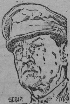
MAC ARTHUR y energía, en

Sin embargo, se gestiona la formación de un Gobierno nacionalista autónomo del de Chungking, a donde se van aproximando los ejércitos de Mao, en la estratégica isla de Formosa, que interesa mucho a los Estados Unidos ya que su armazón defensivo actual en el Pacífico lo constituye el amplio arco que se extiende desde Alaska, a lo largo de las islas principales del Pacífico Occidental, formando la línea estratégica Japón-Okinawa-Formosa-Filipinas que el General Mac Arthur, su creador y vigía, defenderá a toda costa, con decisión en Washington. Formosa no puede perderse.