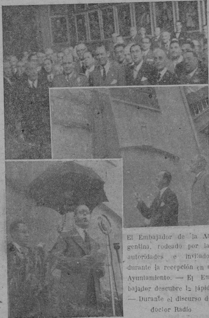
El Embajador de la Argentina, rodeado por las autoridades e invitados durante la recepción en el Ayuntamiento. — El Embajador descubre la lápida. — Durante el discurso del doctor Radio.