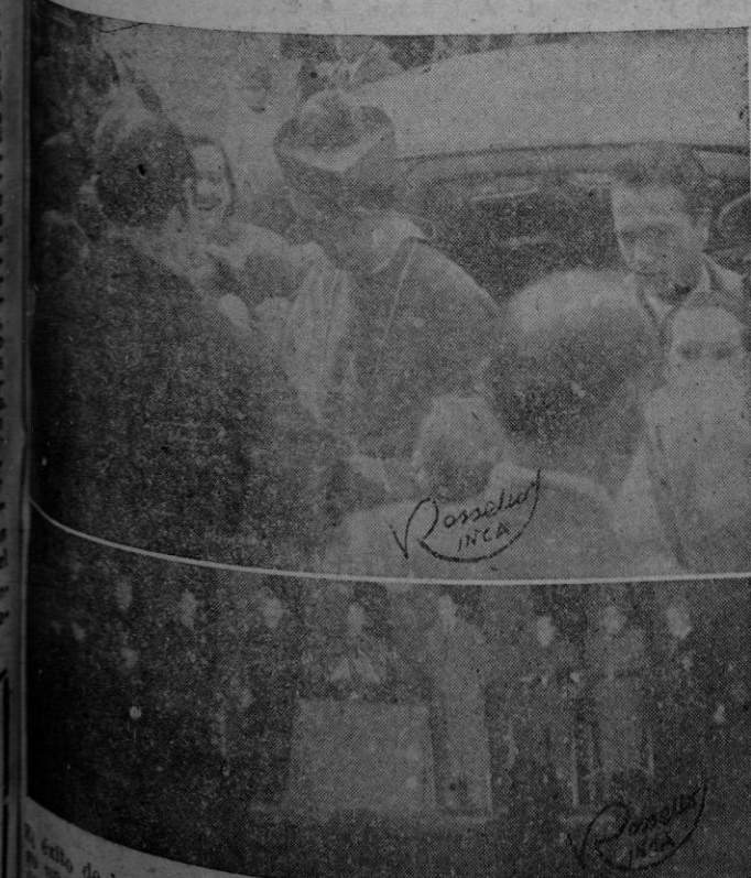
Este es el momento de la gran semana social celebrada en Inca, tuvo el momento más magnífico final, con la presencia del Excmo. y Rldmo. señor Gobernador, a quien se ve en la fotografía superior a su llegada a la ciudad y ocupando más tarde la presidencia de la sesión de clausura. (Ver crónica de nuestro corresponsal en las páginas interiores)