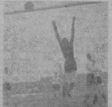
Uno de los nueve tantos que les merecieron a los visitantes.

Si los lectores de LA ALMUDAINA siguieron mis crónicas de la pasada semana pudieron comprobar que las mismas rebosaban optimismo por los cuatro costados. Para muchos tal vez mi exceso de optimismo les hiciera pensar que las palabras por mí escritas eran hijas de un fanatismo sin límites hacia el Constancia. Yo admito y sé positivamente que en el fútbol no existe la lógica y he comprobado muchas veces que no existe tampoco el enemigo pequeño. Pero, al menos en esta ocasión, no nos equivocamos. Lo que nos-