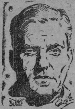
MR. ROBERT BOOTHBY

Diecisiete miembros de la Cámara de los Comunes, once por parte del Gobierno y seis de la oposición, forman la delegación británica para la primera sesión de la Asamblea consultiva del Consejo de Europa, que se celebra en Estrasburgo. Robert Boothby, que figura en el grupo de la oposición es miembro del Parlamento desde 1924 y ha sido secretario privado de Churchill desde 1926 a 1929. Más tarde desempeñó el cargo de secretario del Ministro de Abastecimientos en 1940. Es uno de los miembros más jóvenes del Consejo. (Scrip).