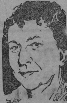
GEORGINA NEESE CLARK

Para el cargo de director del Tesoro norteamericano, el Presidente Truman ha escogido a la señora Neese Clark, que, desde ahora verá su firma estampada en los billetes más codiciados del mundo. Esta señora tiene ahora 49 años y está divorciada de su marido, cambiando el hogar por las finanzas y colocándose como modesta empleada en el Banco Nacional de Richland. En dicho establecimiento ha llegado al cargo más alto, el de presidente, y en él le ha sorprendido la llamada de Truman. Pertenece al partido "demócrata" y parece ser que Truman ha querido corresponder con el nombramiento al apoyo que las mujeres le dieron en las pasadas elecciones presidenciales.