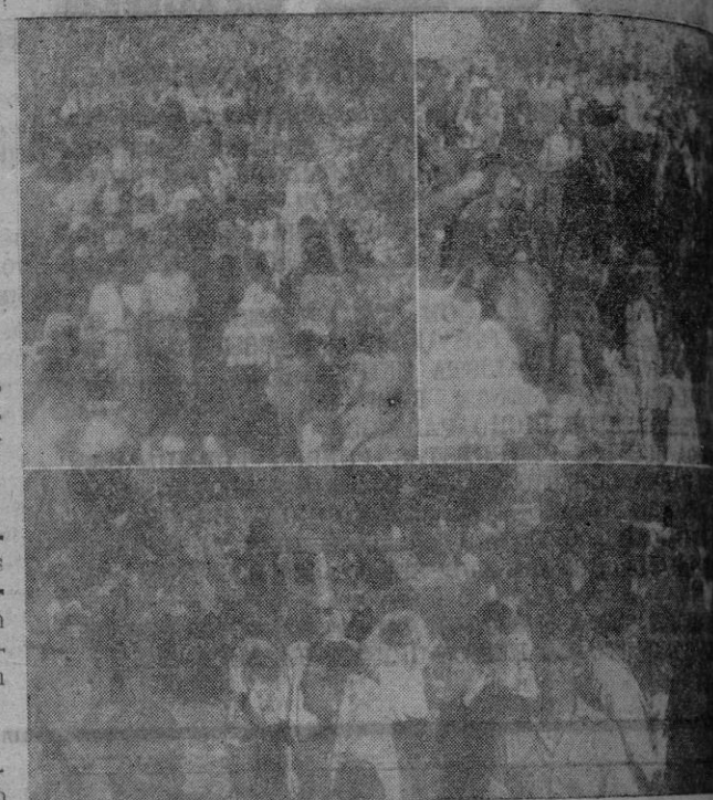
Tres aspectos del numeroso concurso congregado en los alrededores de las grutas

Hubo puestos de refresco de payés amenizado banda de música y cantantes, manteniendo el orden ros de la Guardia Civil concejales.