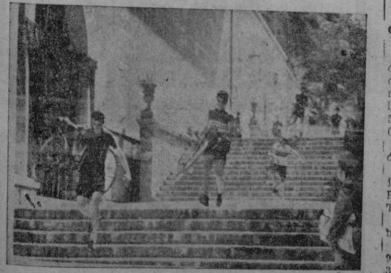
Momento en que los participantes de la prueba organizada por el C. C. Terreno, descienden —con sus máquinas auestas— por las escalinatas de La Seo