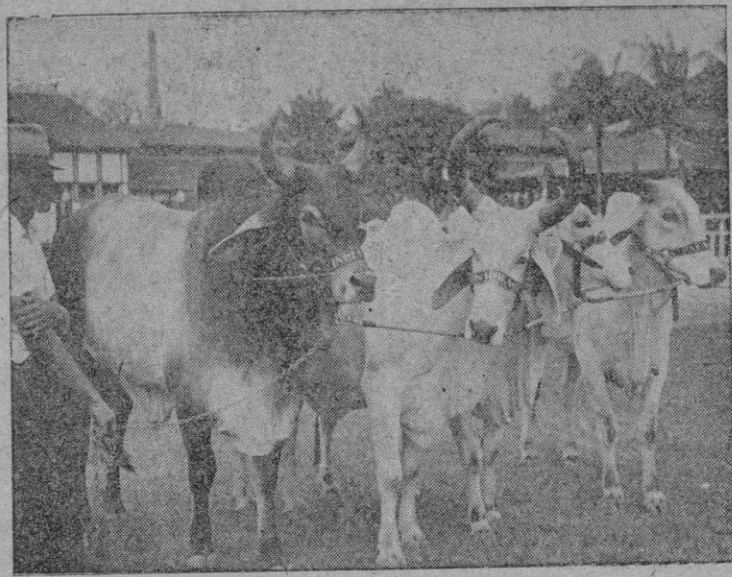
Sao Paulo (Brasil). Presidida por el Ministro de Agricultura, don Daniel de Carvalho, y en representación del Jefe del Gobierno, general Erico Dutra, se ha inaugurado en el Parque de Agua Blanca de esta ciudad la XV Exposición de animales y productos derivados. — En la foto: Una reata de cebúes