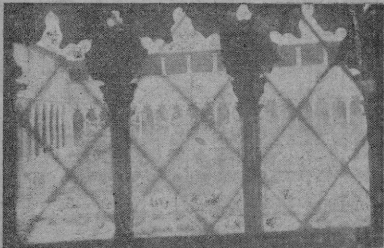
Cloastro de San Francisco, visto a través de la reja de una ventana

Vistió la librea del Patriarca de Asís en el hoy derruido convento de Jesús el 14 de septiembre de 1730, siendo de edad de dieciséis años, nueve meses y veintidós días, y, al año siguiente, profesó en el mismo convento, tomando el nombre de Junipero, por la devoción que tenía a aquel santo compañero del bienaventurado Francisco. Bien sabía el novicio Miguel José que fray Junipero representaba en la Orden la escuela de la simplicidad. ¿No sabéis que el sencillo compañero de san Francisco, para más humillarse, se quitó, una vez, el hábito, y, después de hacer un fardillo, se lo puso sobre la cabeza, sujetándolo con las manos, y, de este modo entró en la ciudad de Viterbo? ¿Qué más diré? A fray Junipero, compañero del humilde Francisco, dije, una vez un fraile enfermo: -Me sería de mucho alivio, si pudieras proporcionarme un pie de cerdo. -Déjalo de mi cuenta -contestó al momento fray Junipero-, que presto estará en mi poder. Se fué, y tomó un cuchillo,