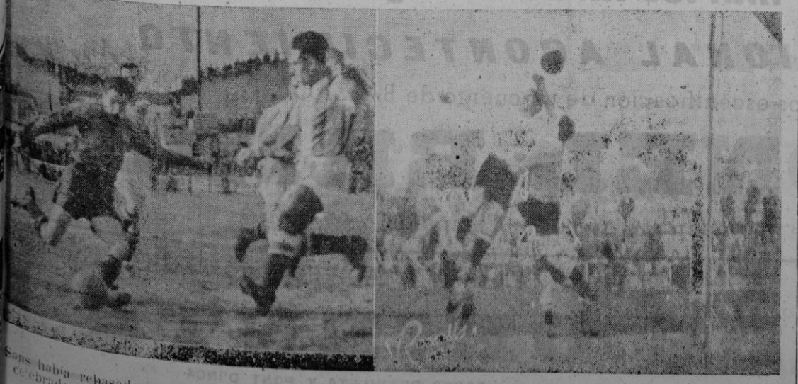
Sans había rebasado al defensa Llopart pero... Prats impediría rematar la jugada, en el partido del Constancia, fue logrado por Rosado en una jugada personal.