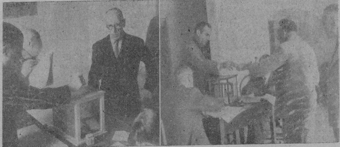
Con todo orden y sin el menor incidente se celebraron el domingo las elecciones para concejales. Dos momentos durante la emisión del voto por los electores. (Véase información en la página 3.ª)