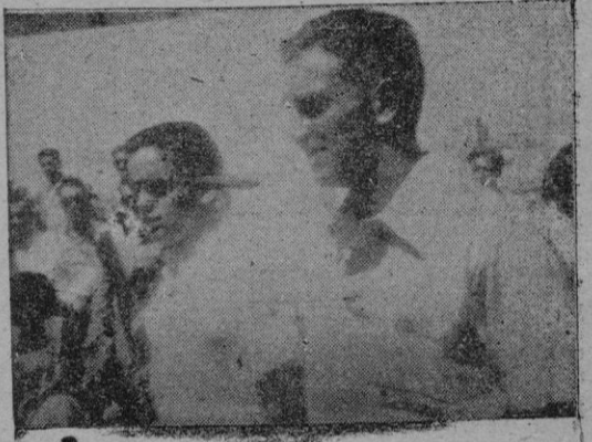
Los representantes de Portugal que en la refrida competición se han clasificado en tercer lugar