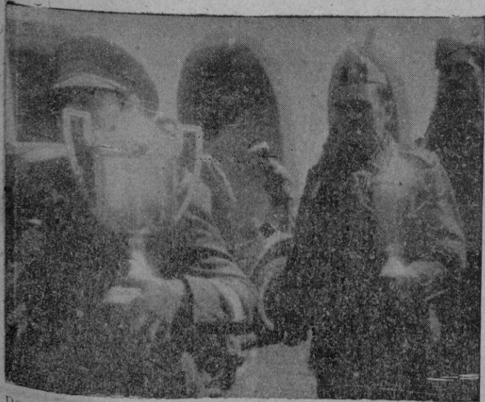
Dos de los componentes de la patrulla del Batallón de la Cruzada, que llegó ayer, con los trofeos ganados