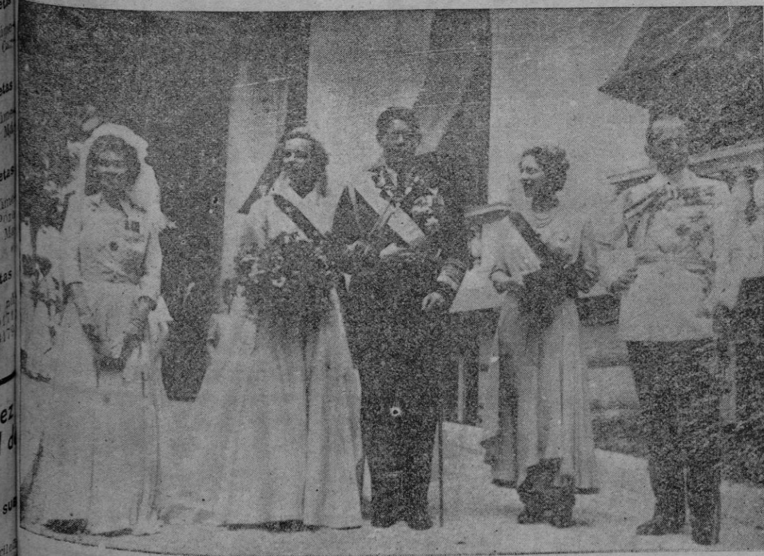
Atenas. — En la capilla del Palacio Real de Atenas se celebró el enlace matrimonial del ex-Rey Miguel de Rumania y la Princesa Ana de Borbón y Parma con arreglo al rito ortodoxo. En la foto acompañan a los esposos la Reina Federica (a la derecha) y la Reina Elena de Rumania, madre de Miguel