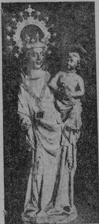
Ntra. Sra. del Puig

Salió la procesión de la Parroquia a las nueve de la noche, precediendo a la venerada Imagen larguísima hilera de hombres con antorchas encendidas, entre cánticos y aplausos de una multitud enardecida. Concejales y miem-