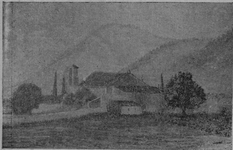
"Oratorio de San Miguel", óleo de A. Colom

No vamos a reseñar todo el programa a realizar, porque resultaríamos demasiado prolijos. Tan sólo diremos que se han editado unos magníficos folletos, que son todo un compendio de buen gusto y en los que la pluma cimera y académica de Mossen Lorenzo Ribera, hijo ilustre del pueblo, ha vertido, en unos históricos párrafos, toda la galanura de su bella y sabrosa prosa.