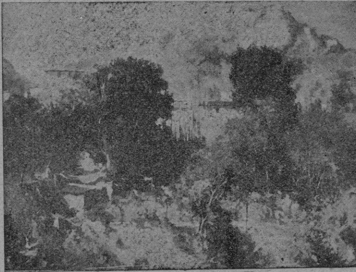
"Paisaje Sóller" óleo de Ventosa

de que es una muestra esta exposición de ahora. Subsisten los demás caracteres generales de su obra que, reel-