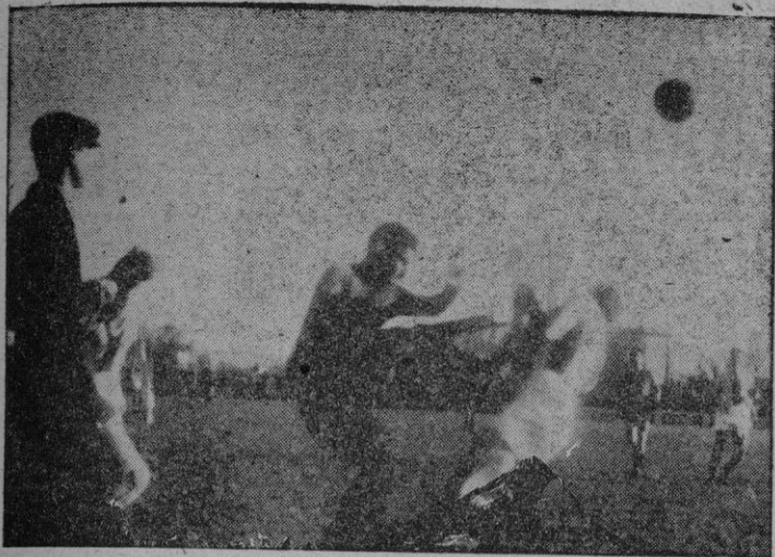
Una jugada en Son Canals