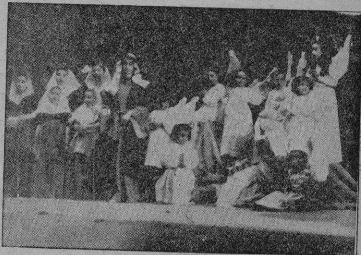
Uno de los cuadros navideños representados por los jóvenes escolares

Interpretó ocho canciones basadas en motivos populares y otras Pels fills d'Adam, D'indi, y los niños del Grupo escolar de Son