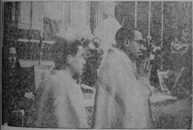
El Obispo Coadjutor durante la ceremonia de la bendición de la imagen de la Virgen de Lluç

A las 10'30 recibieron el Sacramento de la Confirmación 45 niños y 23 niñas después de dirigirlas la palabra el Excmo. y Reverendísimo Sr. Obispo Coadjutor explicándoles y examinándoles sobre la doctrina de este Sacramento.