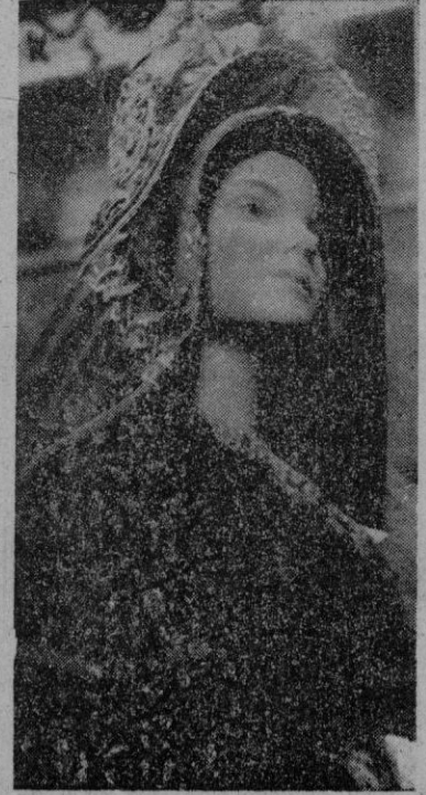
Uno de los banquetes que con los trajes regionales, españoles regados a la señora de Perón, figuraron en la exposición celebrada en Buenos Aires.

A partir del martes se estableció el nuevo tipo de cambio de 8 rublos por 1 dólar y 32'24 por libra esterlina. Todos los extranjeros que residen en Rusia han recibido el mismo trato que las Embajadas. — Efe.