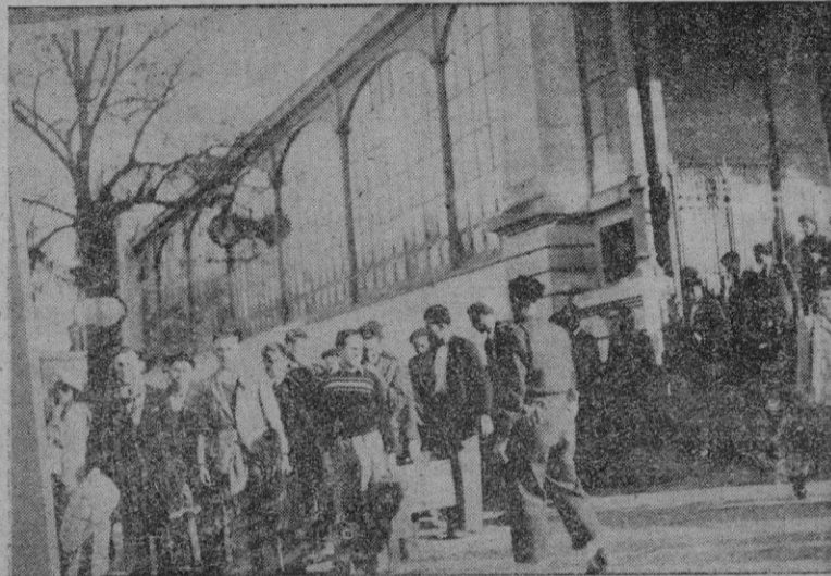
Un grupo de jóvenes movilizados llega a París para incorporarse a filas

El acuerdo fué adoptado al conocerse la propuesta gubernamental y cuando parecía que los conflictos iban a resolverse