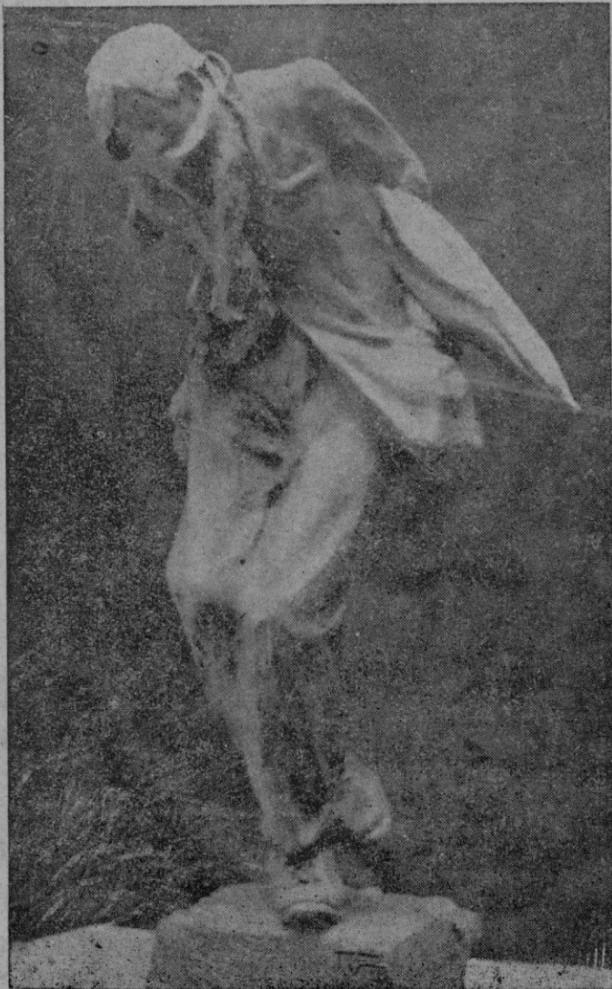
"Enredat de fret", figura en bronce original del escultor T. Vila

Con las fallas que puede tener, aún así, el sistema, fallas que pueden observarse en otros organismos, esa labor estatal constituye una evidente mejora. Y perfección en la misma habrá de representar esta nueva decisión propuesta por el Ministro de la Gobernación. — R.-T.