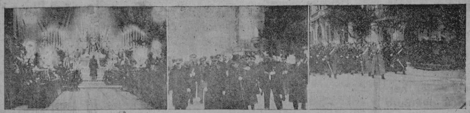
Aspecto del templo. — Las autoridades a la salida de la basílica. — Las fuerzas iniciando el desfile

Y ya anochece cuando el tranvía de Son Roca, recogió en Son Rapinya a los excursionistas para devolverlos a la ciudad.