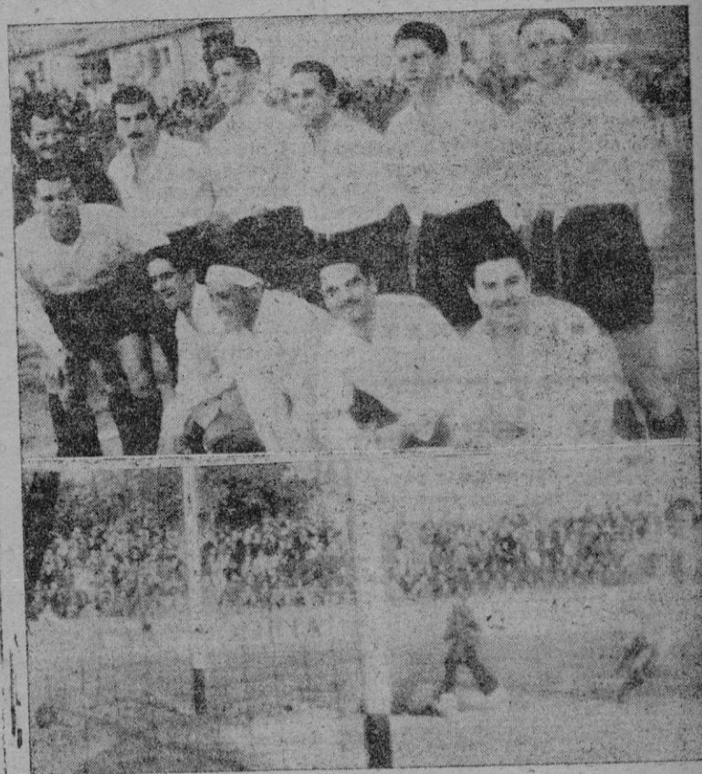
Arriba: El equipo del Constanca, vencedor del Atlético Baleares el pasado domingo en Son Canals. Abajo: El gol logrado por el Atlético Baleares.