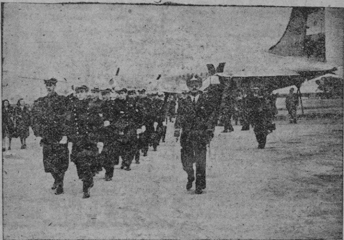
Los cadetes argentinos a su llegada al aeródromo de Barajas.

Barajas.—Al mediodía han salido de aeropuerto de Barajas las tres aeronaves “Santa María”, “La Pinta” y “La Niña” en las que realizan el viaje de regreso a su Patria los cadetes de la Escuela Militar del Aire argentina.