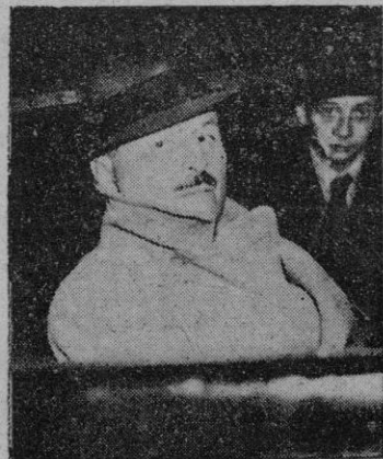
Londres. -- Sir Oswald Mosley, jefe del antiguo movimiento fascista británico, ha pronunciado su primer discurso público después de la guerra

El fascismo británico solo será impedido si es una amenaza contra la ley