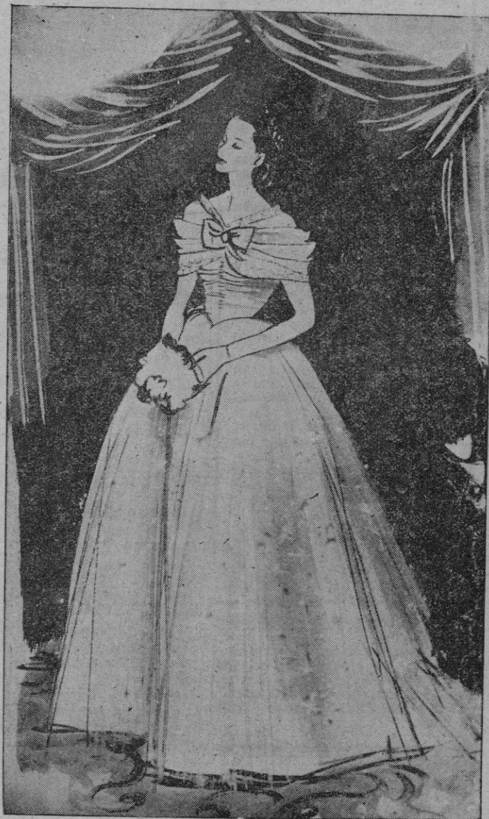
Diseño del vestido que llevaron en la boda de la Princesa Isabel las 8 damas de honor que la acompañaron en la ceremonia religiosa. Es un sencillo traje de "tulle", sobre seda marfil. En la parte delantera lleva unos frunces, que hacen que el vestido vaya muy ajustado hasta la cintura. Los adornos de la falda se asemejan a los del vestido de la Princesa

En resultado de la votación fue: 300 votos a favor de Blum y 277 en contra. Eran precisos 309 votos. -- Efe.