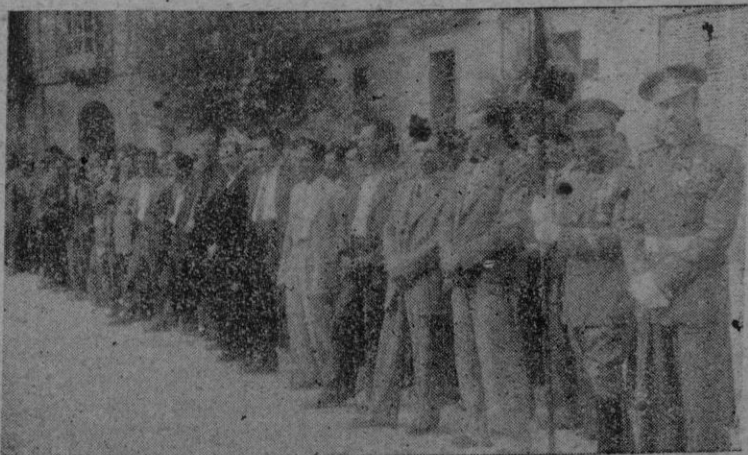
Grupo de Caballeros Mutilados que asistieron a la función religiosa.