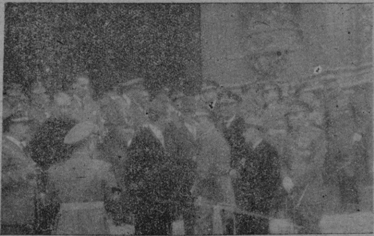
Las autoridades que asistieron a una misa celebrada ayer en la Basílica de San Francisco