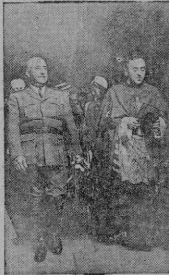
S. E. el Jefe del Estado, Generalísimo Franco, acompañado del Prelado de la Diócesis, sale de la Catedral donde oró ante el Santo Cristo