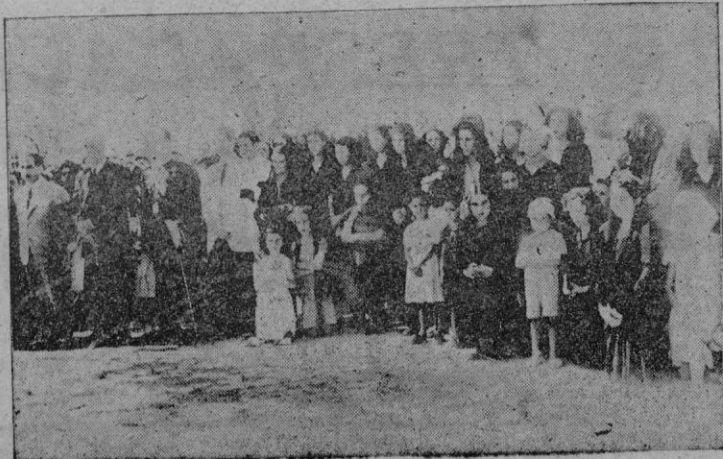
Los familiares de las víctimas de la catástrofe, durante la Misa en sufragio de sus almas, que presidieron las autoridades