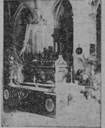
Iglesia parroquial de Valldemosa. Lecho barroco y figura gótica.

En el sopor del día estival, una ráfaga vivificante parece que se expande de los hieráticos y verdes mirabeles y de aquellas aro-