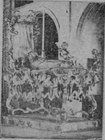
Convento de Santa Clara. - Lecho recocó y Virgen gótica.

crear deshechos aquellos ojos bellísimos que al igual que en un lago terso y azul se reflejaron siempre el amor y la misericordia?!