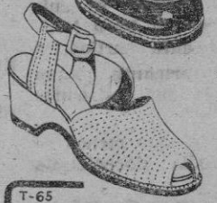
Mod. 50501 Piel blanca. Piso de goma. Del 34 al 39 Pts. 77,50