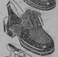
Mod. 58301 Piel y Ante color rubino. Piso de goma. Del 34 al 39 Pts. 94/50