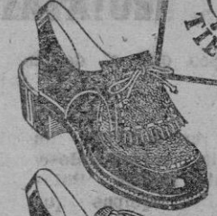
Mod. 58302 Combinado en piel y Ante color rubino. Piso de goma. Del 34 al 39 Pts. 70