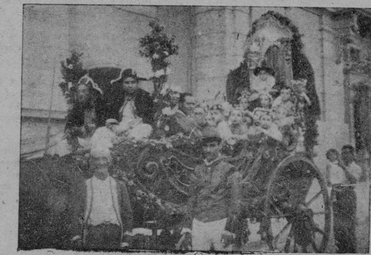
El tradicional Carro de la Beata

Bombay. — El ex primer Ministro de la República Indonésica que se encuentra en esta capital, ha manifestado que la orden de alto el fuego del gobierno holan-