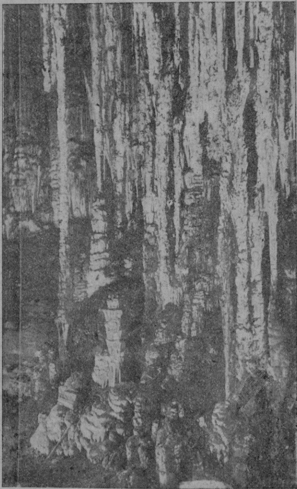
... Esas figuras que forman ciertas estalactitas (tapices colgantes o ponchas tendidas perpendicularmente sobre el agua), se alejan tanto de la razón como las quimeras que un loco entretenido finge en sus horas de soledad.

Retratos en color Minicaturas originales por Raúl Palma