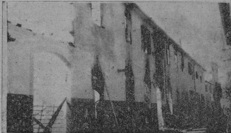
La fachada de la fábrica, después del incendio