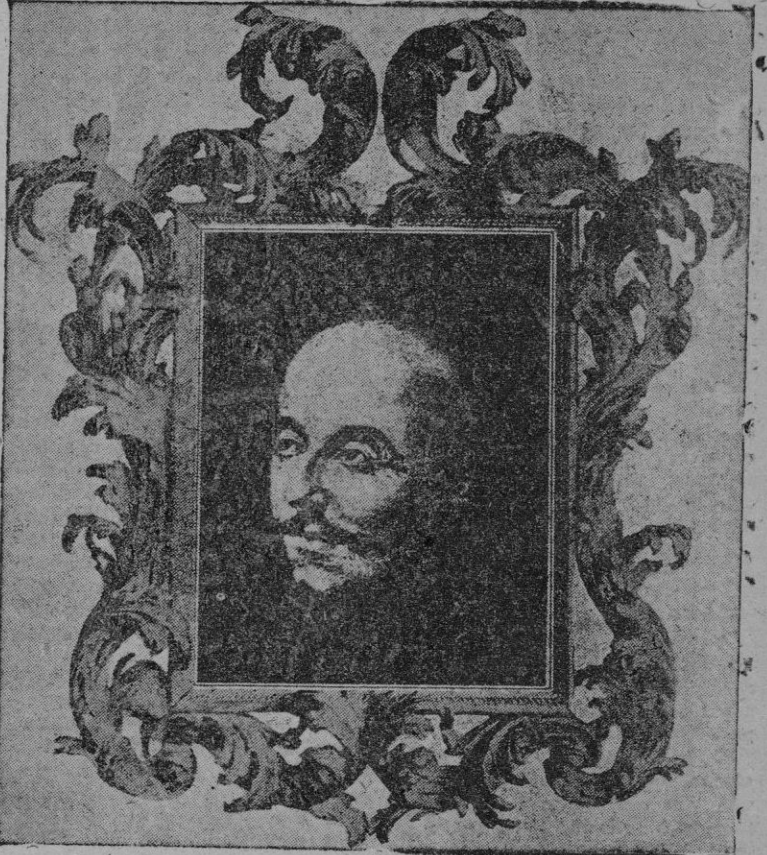
San Ignacio de Loyola, fundador de la Compañía de Jesús, cuya fiesta celebra hoy la Iglesia

Camberra. — El Primer Ministro australiano, Joseph Chifey,