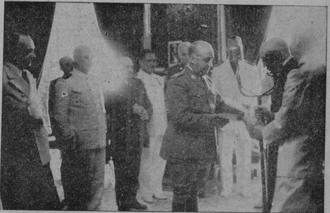
Madrid. — S. E., el Jefe del Estado en el momento de recibir de la Junta Central del Censo, ante los ministros del Gobierno español, el resultado definitivo del referendun del pasado día 6