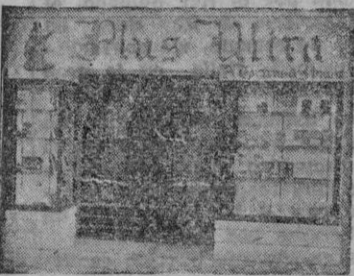
Plaza Sta. Catalina Thomas, 13 Palma de Mallorca

Los "snipes" balearicos nos han dejado en buen terreno. Podemos estar orgullosos de su actuación.