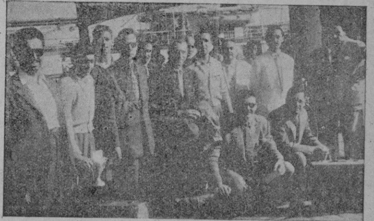
Los nadadores del equipo belga "Mava Club", con algunos directivos del C. N. Palma, que acudieron a recibirlos a su llegada a nuestra ciudad.