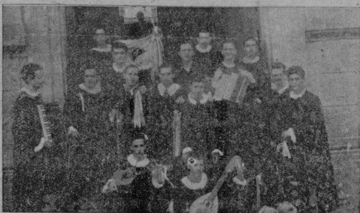
Los componentes de la tuna barcelonesa al salir de una de las visitas a nuestras autoridades.