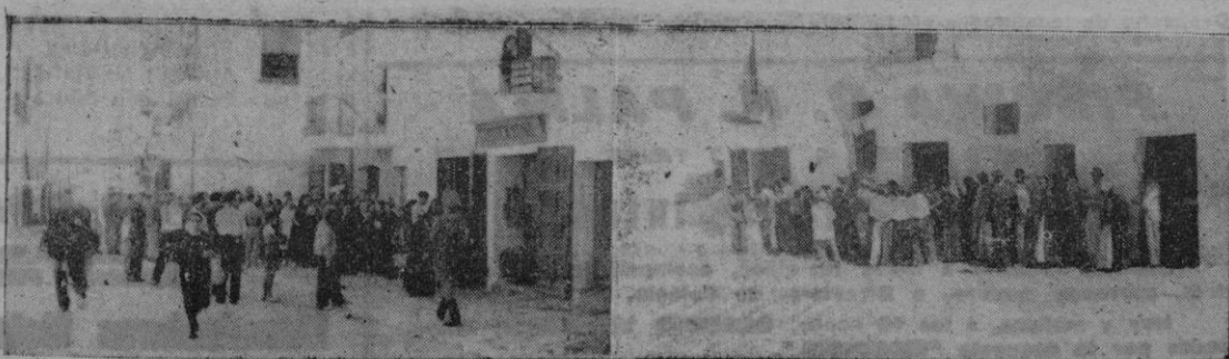
Dos aspectos de la votación del referéndum en Ibiza

Agregó que la creencia general en los Estados Unidos es que los pueblos deben decidir por sí mismos la forma de Gobierno que deseen insistió en que allí donde haya pueblos libres Norteamérica desea tener amigos. Por otra parte