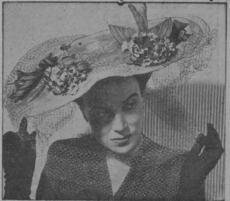
Se advierte en este sombrero la influencia de 1910: copa de paja, alegres adornos de flores y pájaros y el velo constituyen un conjunto que favorece a la cara.

LA ALMUDAINA ha concertado con la AGENCIA EFE la publicación de este apasionante "Diario" que es uno de los más serios y auténticos documentos históricos de la vez que un sensacional reportaje de un cenital episodio de la segunda guerra mundial.