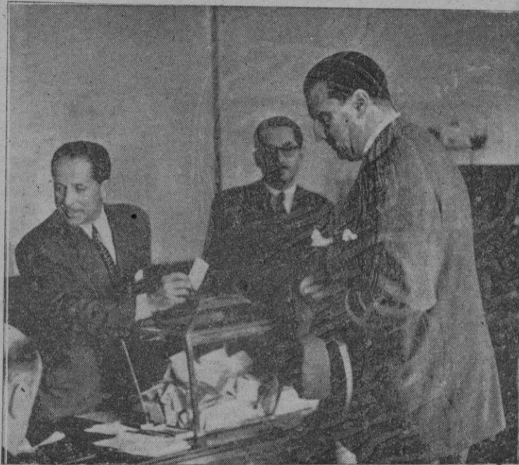
El Referéndum en Madrid. — El Ministro de Asuntos Exteriores Sr. Martín Artajo, en el momento de emitir su voto.