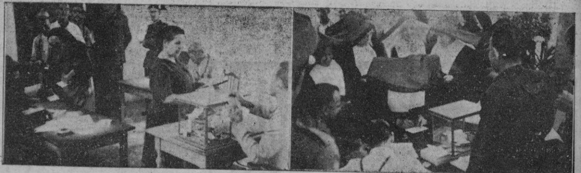
En el Coll de'n Rebassa y religiosas votando en Es Camp Redó