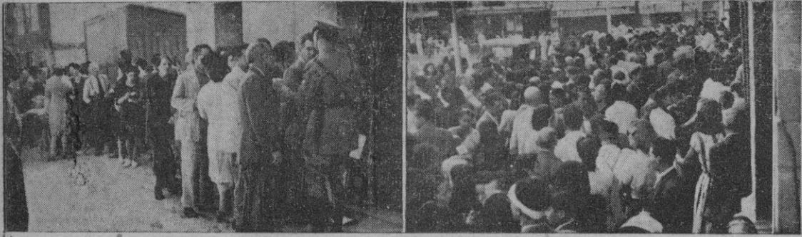
Colas ante los Colegios electorales: Un aspecto de la que se formó en la calle del Teatro Balear y vista parcial de la compacta de la plaza de Cort