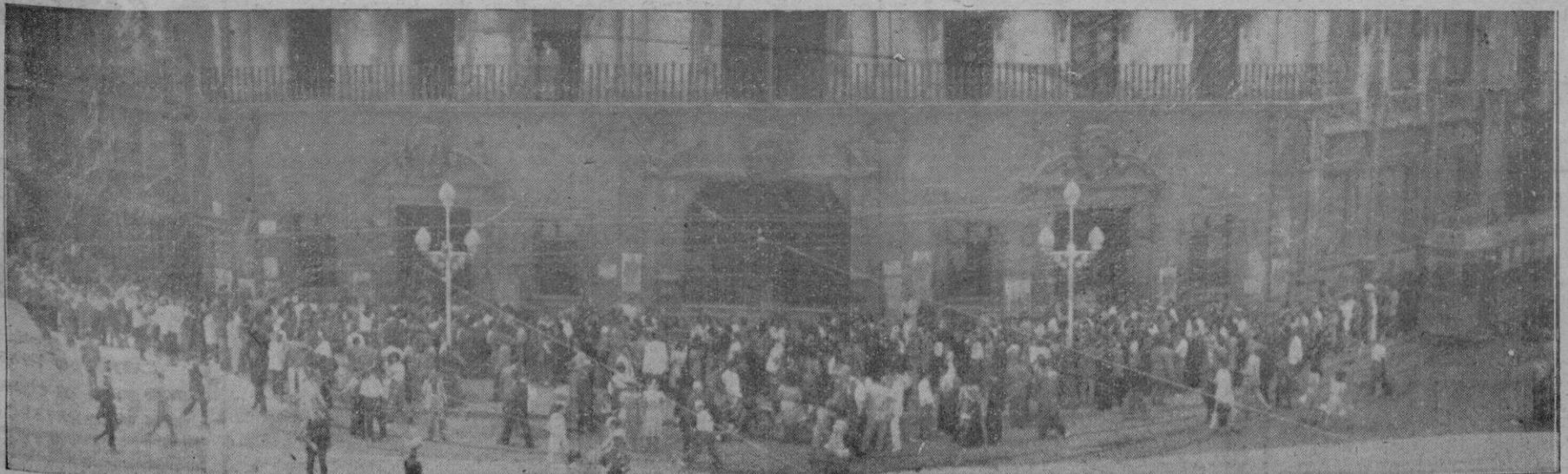
Aspecto que ofrecía el domingo la plaza de Cort, con las largas filas de votantes