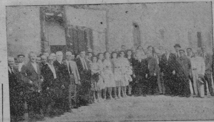
Grupo de Guardias Particulares Nocturnos con las señoras postulantes, a la salida de la función religiosa celebrada ayer

S. E. el Generalísimo despidió a la ilustre dama en el Aeródromo