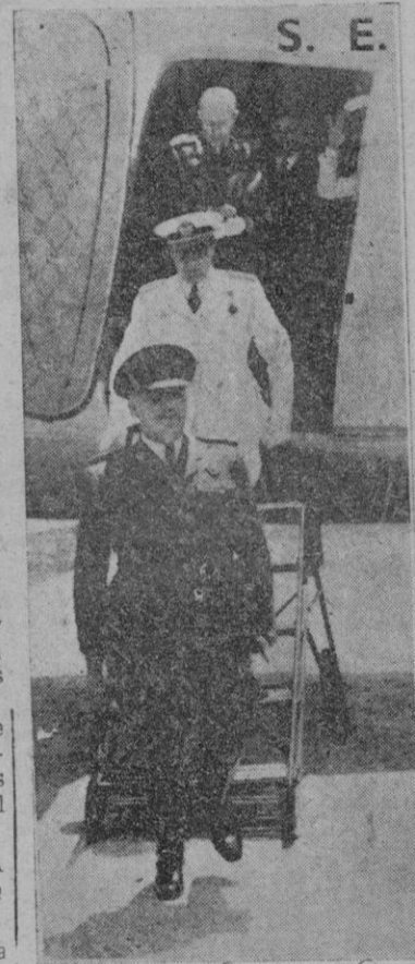
S. E. el Jefe del Estado al descender del avión en el que hizo el viaje de Madrid a Barcelona

Cuatro jefes de Estado participarán en esta sesión, a saber: El Rey de Inglaterra, Presidente Truman, el Generalísimo Chiang-Kai-Chek y el Presidente francés, Auriol. Todos ellos han accedido a tomar parte en la conmemoración. — Efe.