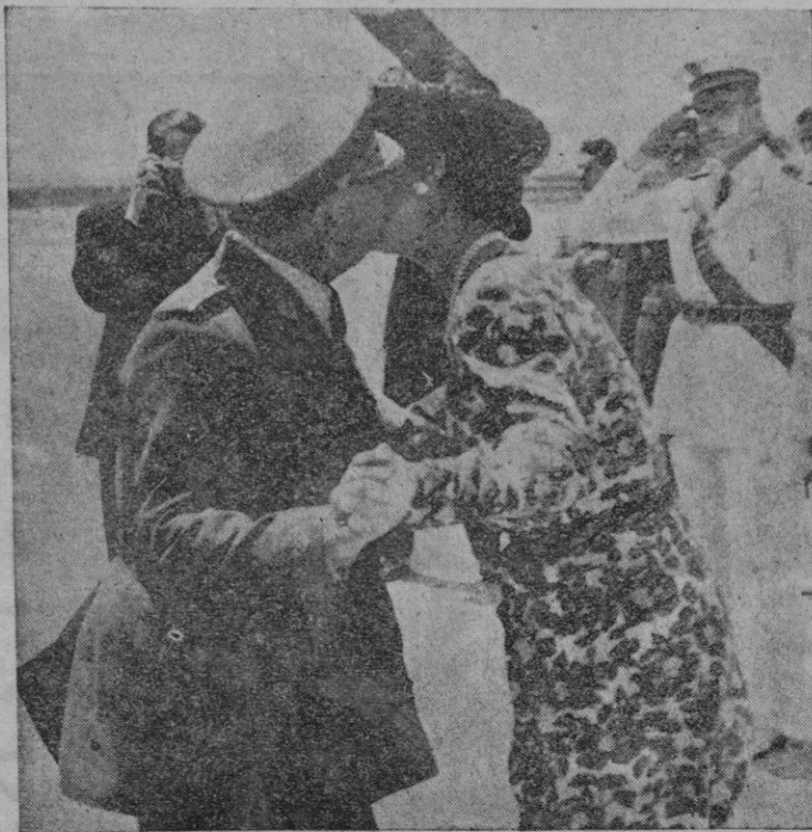
El Generalísimo abraza a su esposa, que acudió a recibirle a su llegada a Barcelona