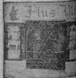
Plaza Sta. Catalina Thomas Palma de Mallorca

Invitan a su distinguida clientela a la inauguración que se celebrará el día 29 de los corrientes a las 12 horas.