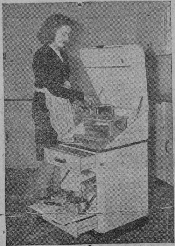
Una cocina para casas pequeñas. A pesar de su pequeño tamaño, la Dura-cookette contiene todo cuanto se necesita para confeccionar toda clase de guisos, dentro de un mueble reducido y de buen aspecto que puede cerrarse cuando no se usa.

Génova, 18. — Catorce de los 15 tripulantes de la motora "María Estella", que se dirigía con cargamento de vino de Sicilia a Génova, perecieron ahogados al chocar la embarcación con una mina. Se hundió en unos minutos frente a la isla de Giglio, en el mar Tirreno. — Efe.