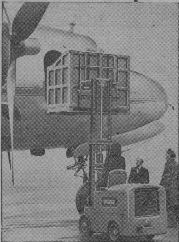
Nuevo aparato para la carga y descarga de aviones. Propulsado por un motor Neadown, tiene mecanismo hidráulico para el ascenso y facilita grandemente las faenas de carga y descarga de aviones.

El primero se aloja en la Casa de los Misioneros de los Sagrados Corazones, congregación a la que pertenece; y el segundo en el Pontificio Colegio Español. -- Efe.