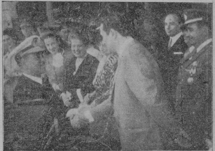
El Excmo. Sr. Ministro de Marina es despedido por las autoridades momentos antes de su salida.

Al objeto de rendirle los honores debidos y en ocasión del regreso a la Península del Excmo. Sr. Ministro de Marina don Francisco Regalado, ayer poco después de las once de la mañana formó en el muelle de la Consigna una compañía del tercio de Infantería