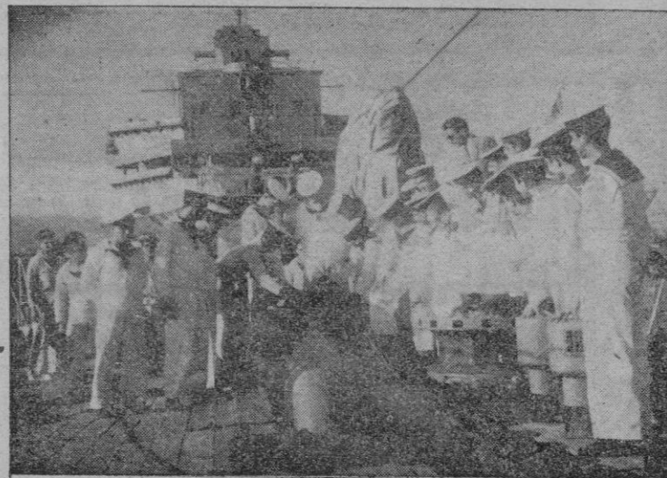
Los alumnos de la Escuela de Flechas Navales visitaron ayer el crucero "Galicia". Sobre la cubierta del buque siguen atentamente las explicaciones y detalles acerca del buque y de la vida a bordo.

A la mayor brevedad debéis personaros en vuestro Sindicato a recoger la Cédula de Inscripción en el Censo Electoral mediante la cual al propio tiempo que cumplis un deber que te evitará incurrir en sanción gubernativa, ejercer el derecho de ser incluido en las listas del Censo Electoral Sindical para designar libremente tus representantes y poder ser proclamado candidato.