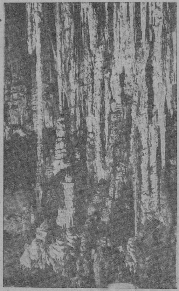
... Esas figuras que forman ciertas estalactitas (tapices colgantes o ponchas tendidas perpendicularmente sobre el agua), se alejan tanto de la razón como las quimeras que un loco entretenido finge en sus horas de soledad.

El próximo domingo cuestación de "Auxilio Social"