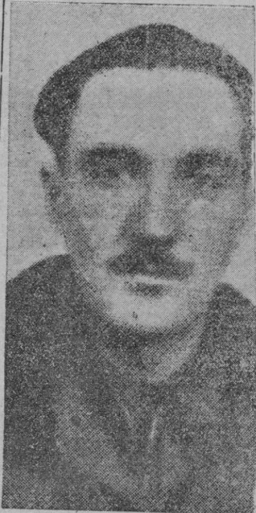
D. José M. Alfaro, nombrado en el último Consejo, Ministro Plenipotenciario de España en Bolivia

El Cuerpo Diplomático fué convocado para tratar del asunto presidencial mientras la guardia nacional rodeaba el palacio.—Efe.