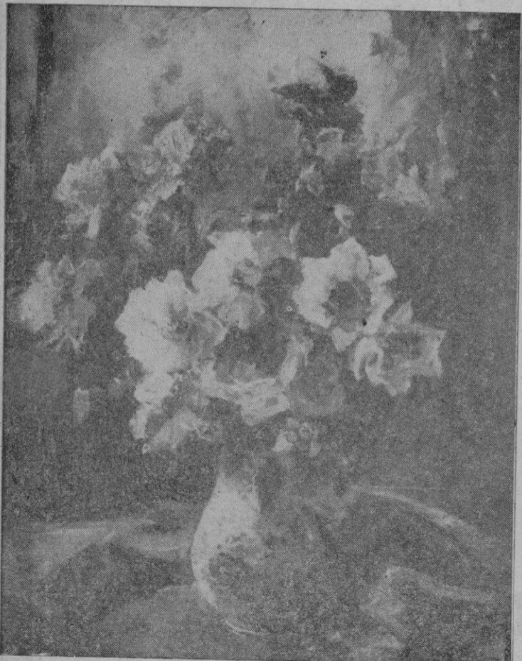
"Flores", óleo de Domingo Carles

diacóculos; sencillos, delicados, tendientes al logro de tal intención que desde luego puede darse por realizada en obras como por ejemplo ese pequeño cuadro, (número 7) con un fondo de azules densos de montañas, un cielo y unas masas ocrosas incluso empastadas de peculiar manera y propio de quien, en época no propia, subrayase energicamente la justa subvalorización de un Marfí y Alsina o un Vayreda. Este paisaje y otro, como el número 4, vistos con gran obediencia en el tema y sujeción personal, tienen un encanto singular.