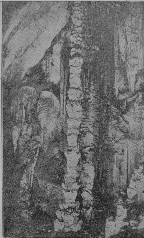
... En seguida salen al paso formas oscuras que semejan brujas, fantasmas ensabanados, muertos que hacen muecas de una fúnebre ironía. Y el techo, entretanto, adopta el estilo de una bóveda apuntada, como si estuviéramos prácticamente en una catedral gótica, mientras las columnas, de traza inverosímil, nos hacen recordar las pagodas de Siam y de la Judea.

San Sebastián, 22. En la clasificación general de la Vuelta continúa Delio ostentando el primer puesto.