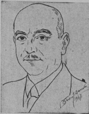
Pedro Barceló. - Autoretrato

Pedro Barceló comenzó a pintar movido de una voluntad irrefrenable. Fué su profesor Anckermann, pintor de grandes grupos alegóricos, de plafones con composiciones de colores sutiles. Anckermann ya gozaba, con Ribas y Terrasa, de una madura plenitud.