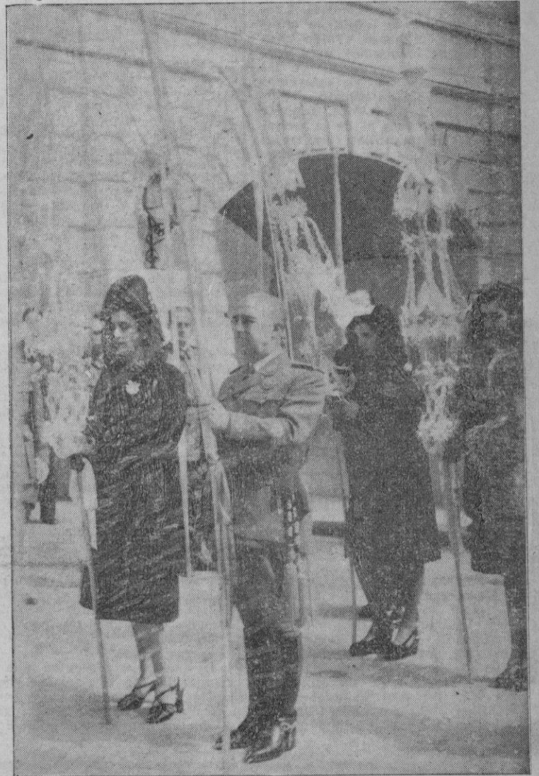
Un momento de la solemne procesión de las Palmas en El Pardo, en la que tomaron parte S. E. el Jefe del Estado y familia y jefes de su Casa Militar y Civil