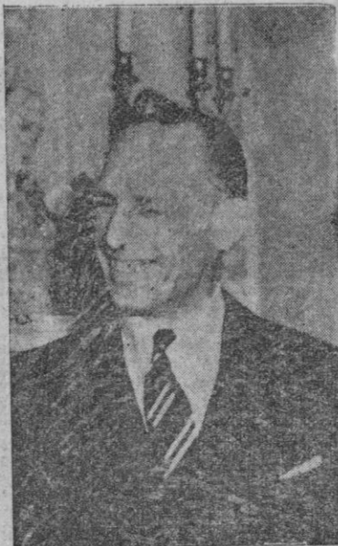
El Rey Jorge II de Grecia que ha fallecido repentinamente

Lie fué quien designó los funcionarios administrativos de dicha comisión entre los cuales se encuentra una mayoría de filo-comunistas, entre ellos el jefe de dicho personal que se eleva a un total de ciertas personalidades del Departamento de Estado desean que Lie presente su dimisión y que dicho departamento han salido algunos de los rumores contra el Secretario General de la O.N.U. -- Efe.