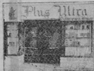
Plaza Sta. Catalina Thomás, 10 Palma de Mallorca